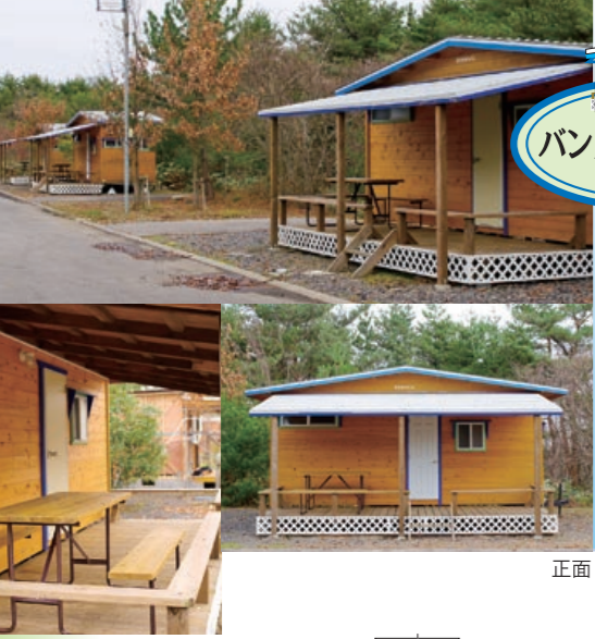
バンガローサイト